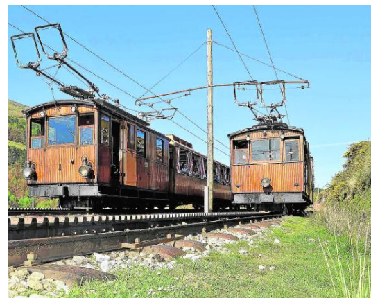
Tren de Larrun, en el País Vasco francés

El nuevo portal online español de alquiler de embarcaciones Wahiva ofrece en su plataforma más de 6.000 embarcaciones de recreo registradas en casi 20 países de Europa, Asia y América, para alquilar durante fines de semana y vacaciones. Funciona en los destinos más bellos del mundo, desde Croacia, Grecia y Baleares hasta el Caribe, pasando por Nueva Zelanda, Australia... Wahiva ofrece todo tipo de barcos (veleros, catamaranes o yates) y precios, desde una lancha pequeña por medio día -400 euros- hasta un megayate por días o semanas, a partir de 100.000 euros la semana, o más. Se puede navegar por cuenta propia, siempre y cuando se disponga de titulación para ello, o con patrón y, a partir de ahí, todo tipo de servicios añadidos.