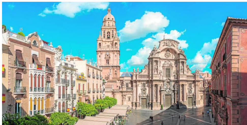
Imagen de la fachada de la Catedral de Murcia

LA CIUDAD ALBERGA EL 3 Y 4 DE MAYO EL WARM UP FESTIVAL