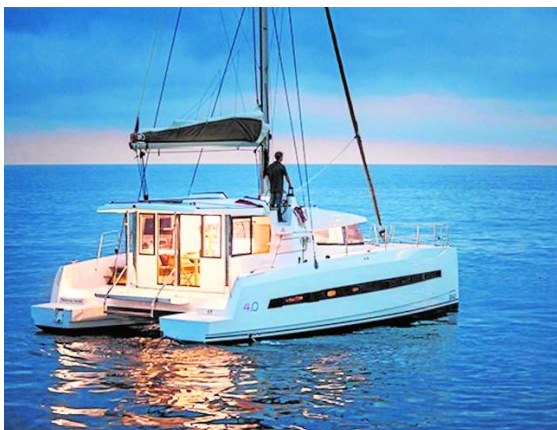
Alquilar un barco, otra opción de vacaciones

A las condiciones naturales de la isla y la gran infraestructura en materia deportiva y de alojamientos, se suma la celebración de grandes eventos que sitúan a Gran Canaria como un destino deportivo de referencia en Europa, como son la Transgran Canaria, una de las pruebas de trail running más duras del mundo, o el Gloria Challenge Mogán Gran Canaria. Para dar a conocer sus bondades nace Gran Canaria Tri, Bike & Run -www.grancanariatribikerun.com-, marca oficial de la isla para su promoción como destino de turismo deportivo y que reúne a las principales empresas deportivas y hoteleras de Gran Canaria. Más comodidad para realizar un stage o simplemente para disfrutar de su pasión.