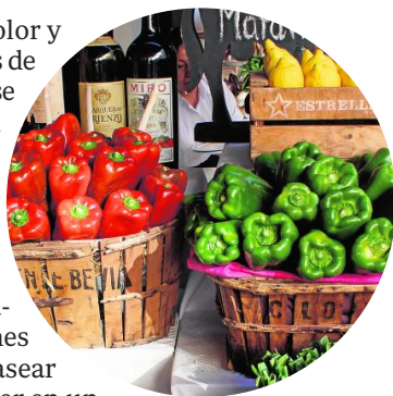
Productos de la huerta de Murcia

Además de la visita a los principales monumentos, la ciudad ofrece un importante número de museos entre los que destacan el Museo Salzillo, con la mejor colección de escultura religiosa del siglo XVIII, obra del maestro Francisco Salzillo; el de Santa Cla-